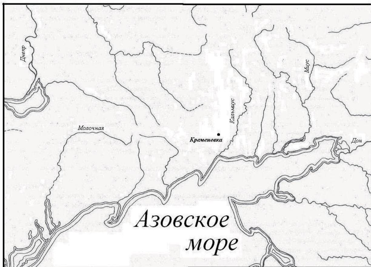
Рис. 1. Кременевка. Карта-схема местонахождения.

группа из двадцати пяти курганов. Восемь из них были исследованы в 1977 году Донецкой экспедицией под руководством С.Н. Братченко[1]. В 2 км к юго-западу от села на р. Кальчик было раскопано десять курганов с погребениями ямной, срубной культур и скифскими[5,с.62].