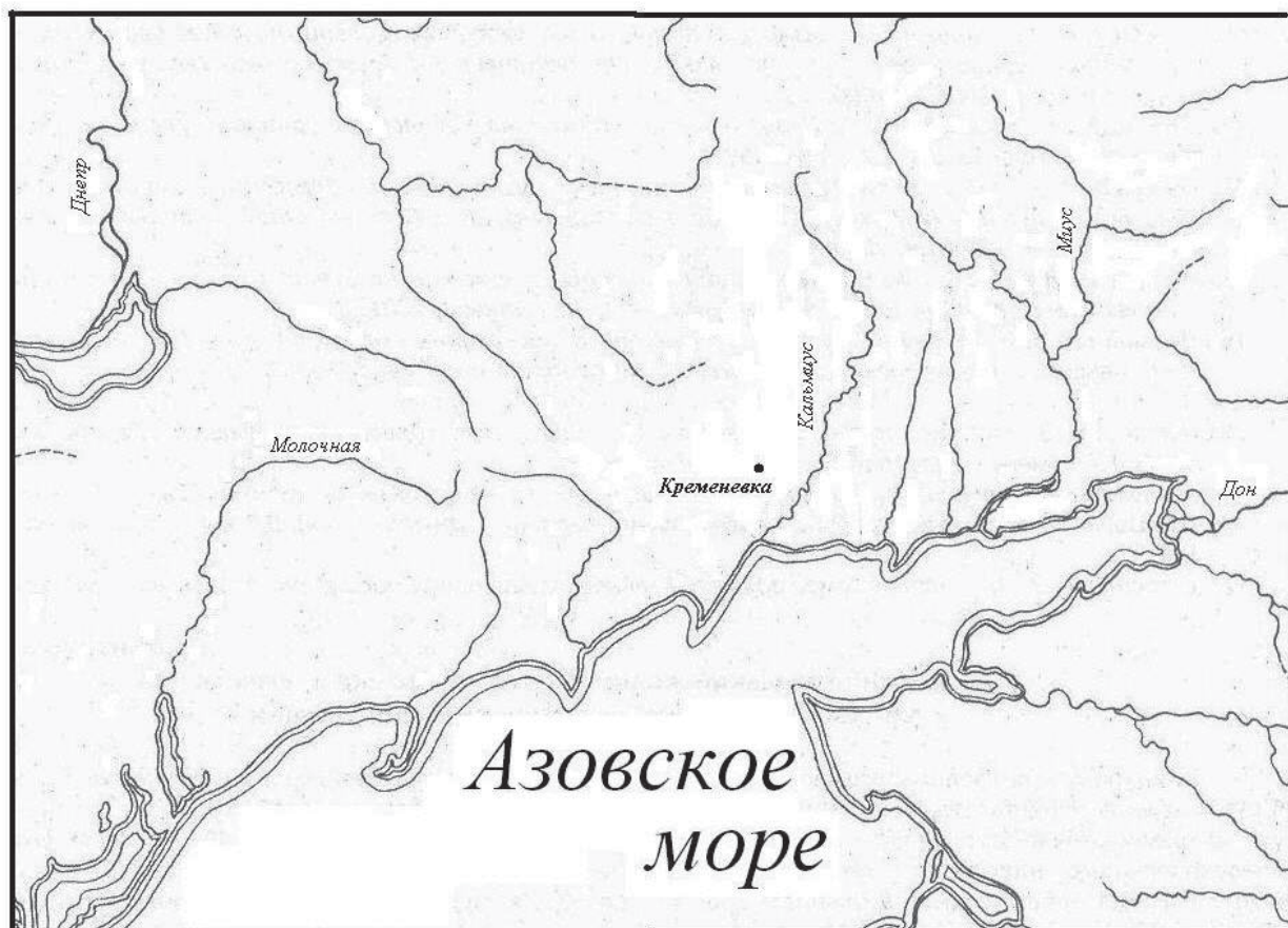
Рис. 1. Кременевка. Карта-схема местонахождения.

Рельеф микрорайона характеризуется высокоподнятыми, протянувшимися на многие километры, широкими гривами водоразделов. Их изрезанные балками подошвенные склоны полого, а на отдельных участках скалисто, спускаются к реке. В ближайшем от памятника расстоянии находятся другие археологические древности. В частности, в 5 км к юго-западу от села на водоразделе Кальчика, Калки и Кальца возвышается группа из двадцати пяти курганов. Восемь из них были исследованы в 1977 году Донецкой экспедицией под руководством С.Н. Братченко[1]. В 2 км к юго-западу от села на р. Кальчик было раскопано десять курганов с погребениями ямной, срубной культур и скифскими[2,с.62].